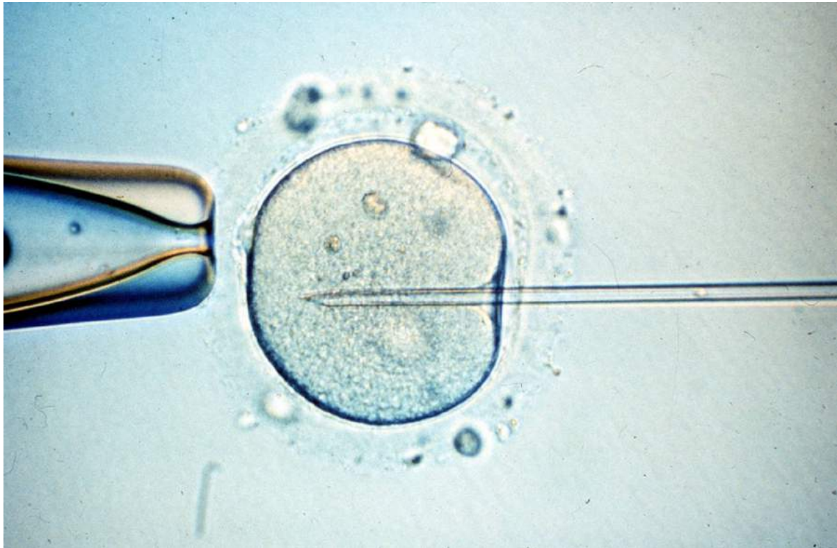
Pruebas en el laboratorio de Inescop. El instituto tecnológico Inescop investiga la obtención de piel in vitro para garantizar la materia prima al sector del cazado.

opción, el centro que tiene más éxito, el que tiene mejor marketing, o por el boca a boca. Si el primer intento falla y deciden cambiar de centro, se suele elegir valorando otros elementos, más dirigidos al cuidado y al trato recibido”.